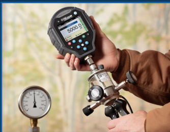
게이지 & 보정 참조

Ralston 인스트루먼트는 광범위한 용도에 완벽한 압력 보정 솔루션을 제공하여 시간을 절약하고 중요한 압력 테스트 , 유지 보수 및 수리 작업에서 추측을 배제합니다 .