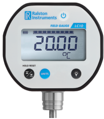
Field Gauge LC10-TA 디지털 프로브 온도계