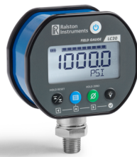
Field Gauge LC20