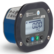
패널 장착형 Field Gauge LC30

Ralston 인스트루먼트는 광범위한 용도에 완벽한 압력 보정 솔루션을 제공하여 시간을 절약하고 중요한 압력 테스트 , 유지 보수 및 수리 작업에서 추측을 배제합니다 .