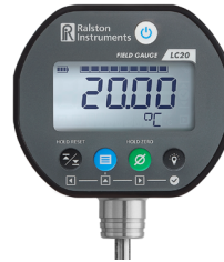
Field Gauge LC20-TA 디지털 프로브 온도계