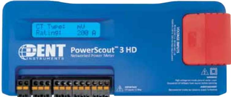
사진은 DIN 레일형 제품(PS3HD-R-D-N), 벽걸이형 제품 또한 이용 가능 (PS3HD-C-D-N)