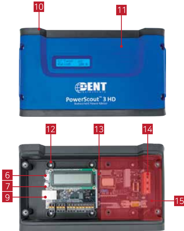
벽걸이형 인클로저 PS3HD-C-D-N