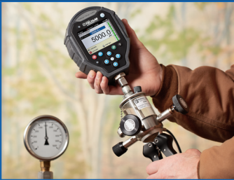
게이지 & 보정 참조

Ralston Instruments 는 광범위한 용도에 완벽한 압력 보정 솔루션을 제공하여 시간을 절약하고 중요한 압력 테스트 , 유지 보수 및 수리 작업에서 추측을 배제합니다 .